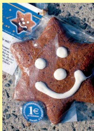
Mit dem Glücksstern kann der Deutsche Kinderschutzbund e. V. unterstützt werden.

Glückssterns zu 2,50 Euro erhält der jeweilige Deutsche Kinderschutzbund vor Ort einen Euro.