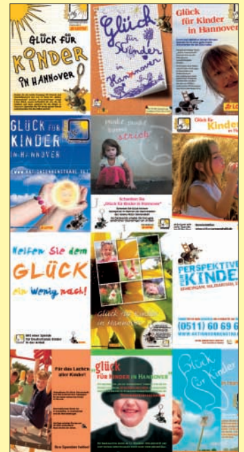
Insgesamt zehn Plakate zeichnete der VDMN beim 16. Gestaltungswettbewerb aus.

Der 17. Gestaltungswettbewerb wird im Herbst 2007 ausgeschrieben. Weitere Infos dazu gibt es unter www.vdmn.de .